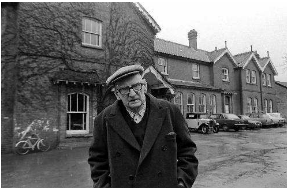
Alexander Sutherland Neill